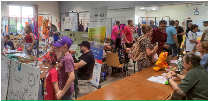
Samedi 6 septembre de 15 h à 18 h : forum des associations, organisé par la municipalité et les associations vernoises