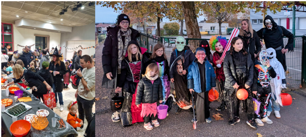
Vendredi 31 octobre : Halloween, organisé par l'Association des Parents d'Élèves de l'École de Verny