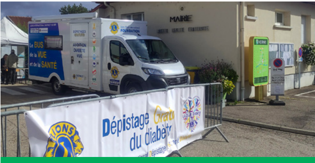
Dimanche 5 octobre : Le « bus de la vue » du Lions Club, à l'occasion de la brocante de la fête patronale, organisée par l'Amicale des Sapeurs Pompiers de Verny. Restauration et buvette par l'Amicale et les Archers du Vernois