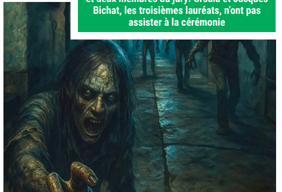
Du vendredi 31 octobre au dimanche 2 novembre : Escape game au Fort Wagner, dans le cadre du festival Bêtes et Sorcières de Moselle sans limite