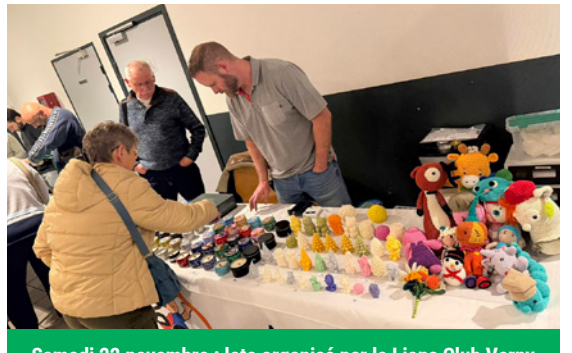
Samedi 22 novembre : loto organisé par le Lions Club Verny Val de seille, au profit de Léo et sa Dream'Tim et des autres œuvres soutenues par le club

On peut citer aussi : les journées du patrimoine au Fort Wagner, le loto de 12 h du Football Club Verny Louvigny le 25 octobre, le loto des Archers du Vernois le 8 novembre, le marché de Noël de P'tit bout de fil Vernois avec l'APE.