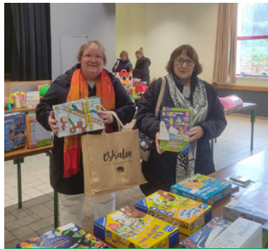
Dimanche 16 novembre : bourse aux jouets et articles de puériculture de l'AFRV