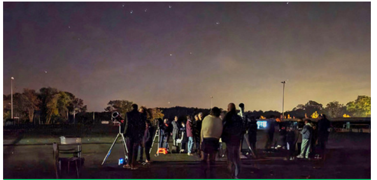
Samedi 11 octobre à partir de 20 h : « Jour de la nuit » animation astronomique, organisée par la municipalité avec le club d'astronomie de Metz M57