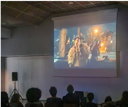
Jeudi 30 octobre : 1ère séance de « Cinéma en campagne »