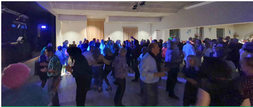
Samedi 18 octobre : repas dansant, musique des années 80-90, organisé par l'association Cancer Action au profit du comité de Moselle de La Ligue contre le cancer