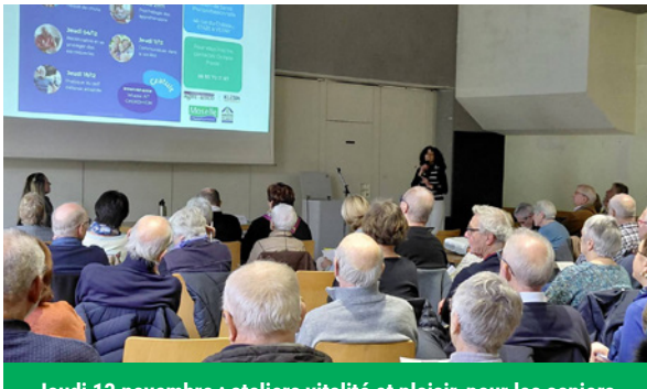
Jeudi 13 novembre : ateliers vitalité et plaisir, pour les seniors, organisés par la Maison de Santé Pluriprofessionnelle et ses partenaires