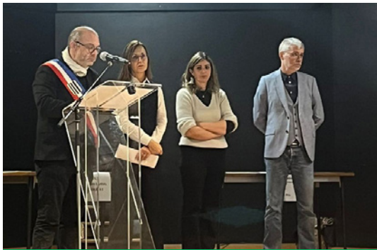
Vendredi 7 novembre : cérémonie de remise du diplôme du brevet des collégiens de Verny