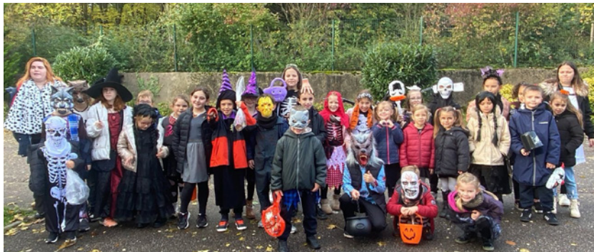
Jeudi 23 octobre : Halloween avec les Diablotins, organisé par le périscolaire