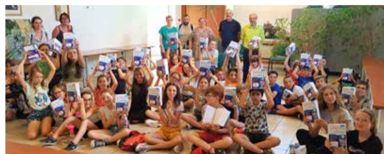
Remise des dictionnaires offerts par la municipalité aux élèves de CM2 pour leur rentrée au collège.