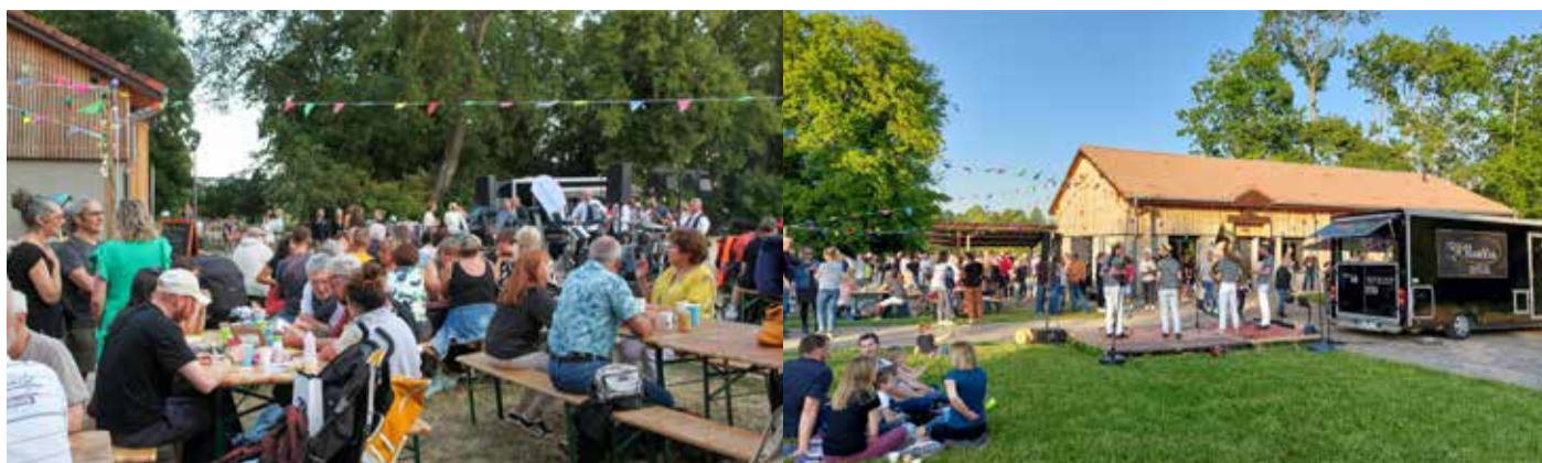
La Guinguette du Parc : 4 soirées festives organisées par Verny Musiques Actuelles (le 3 e vendredi des mois de mai à août).

Responsable de la publication : Victorien Nicolas Articles et photos : les conseillers municipaux Mairie de Verny : 6 rue de la Mairie / 57420 Verny Tél : 03 87 52 70 40 mairie@verny.fr https://www.verny.fr