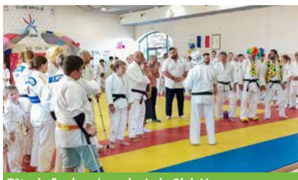
Fête de fin de saison du Judo Club Verny.