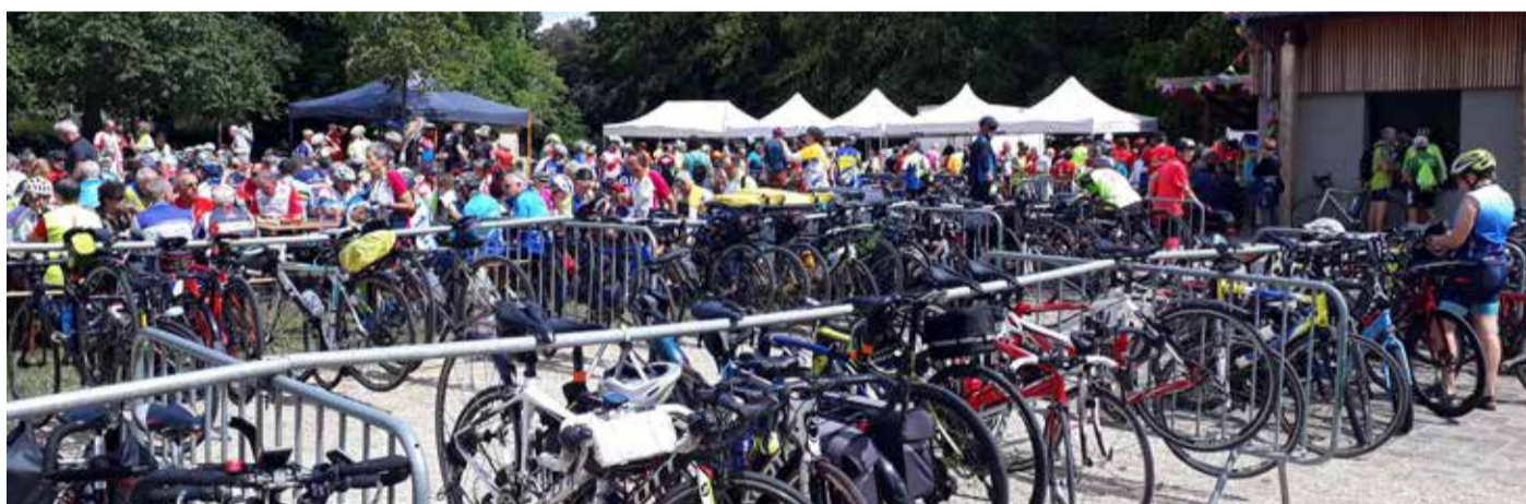
84 e semaine fédérale internationale de cyclotourisme : des milliers de cyclistes de passage au point d'accueil de Verny mis en place dans le Parc avec le concours de nombreux bénévoles et des associations vernaises.