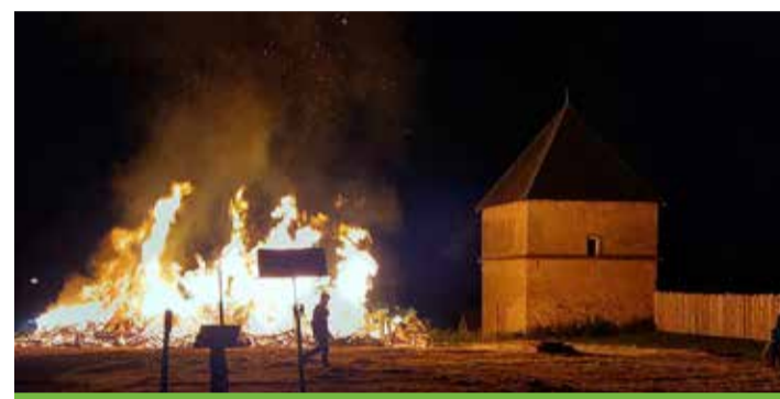
Feu de la St Jean : organisé par le Tennis Club, animation par l'atelier scène de Verny Musiques Actuelles et par un DJ.