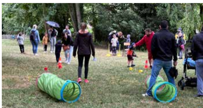
Les olympiades pour les enfants de l'école, organisée par l'APE le 1 er juillet dans le Parc du Château.