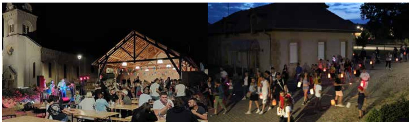
Fête nationale : restauration organisée par le Football Club, animation par Verny Musiques Actuelles et défilé au lampions organisé par la municipalité (feu d'artifice annulé en raison des risques d'incendie).