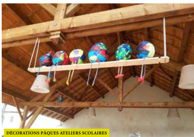
DÉCORATIONS PÂQUES ATELIERS SCOLAIRES