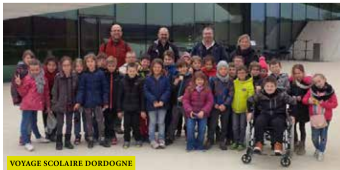
VOYAGE SCOLAIRE DORDOGNE